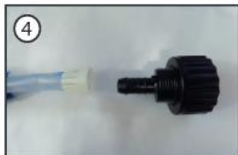
4) Pielieciet šļūtenei beigās balto savienojumu.