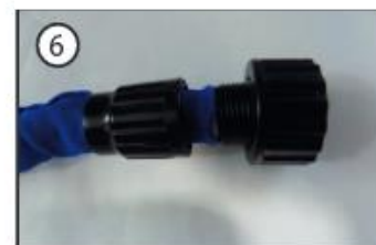
6) Pārvelciet pāri zilo lateksa materiālu un saskrūvējiet uznavu ar ventili.

Izplatītājs: SIA TVshopEXTRA.lv, Vienotais reģistrācijas numurs: 40103807818