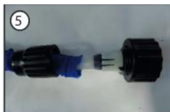
5) Uzlieciet atpakaļ savienotāj uznavu, uzmanieties, lai savienots cieši.